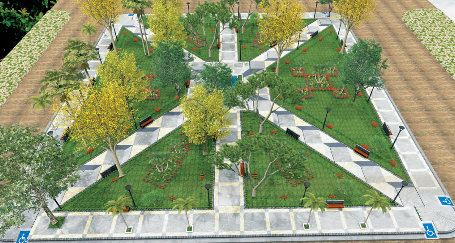
IMAGEN DIGITAL DE LA PLAZA PRINCIPAL DE YACUSES