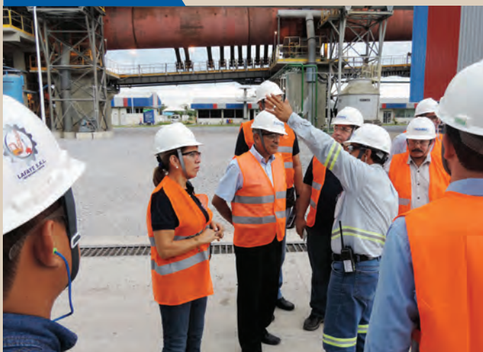
PLANTA. EN EL TALLER DE INTEGRACIÓN TRANSFRONTERIZA SE HIZO EL RECORRIDO POR LAS ÁREAS DE ACCIÓN