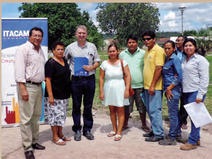
PLAZA. LA ALCALDÍA DE PUERTO SUÁREZ E ITACAMBA CEMENTO S.A. FIRMARON EL ACUERDO QUE ESTABLECE LAS CONDICIONES PARA INICIAR LA RENOVACIÓN DE LA PLAZA PRINCIPAL DE YACUSES.