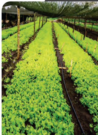
EN PORTADA, UNO DE LOS PROYECTOS DE AGRICULTURA SOSTENIBLE APOYADOS POR ITACAMBA